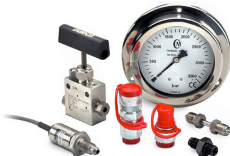
Racores de alta presión